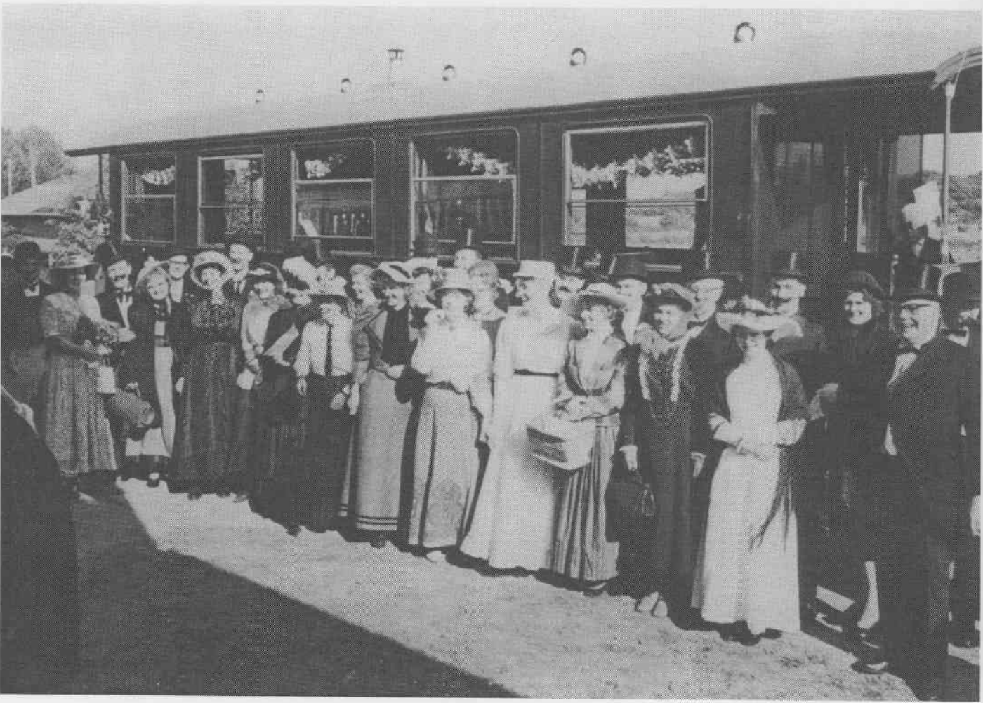
Langlandsbanens sidste tur 1962