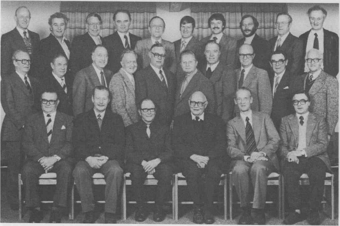
Sangerleden ved 100-året 1982