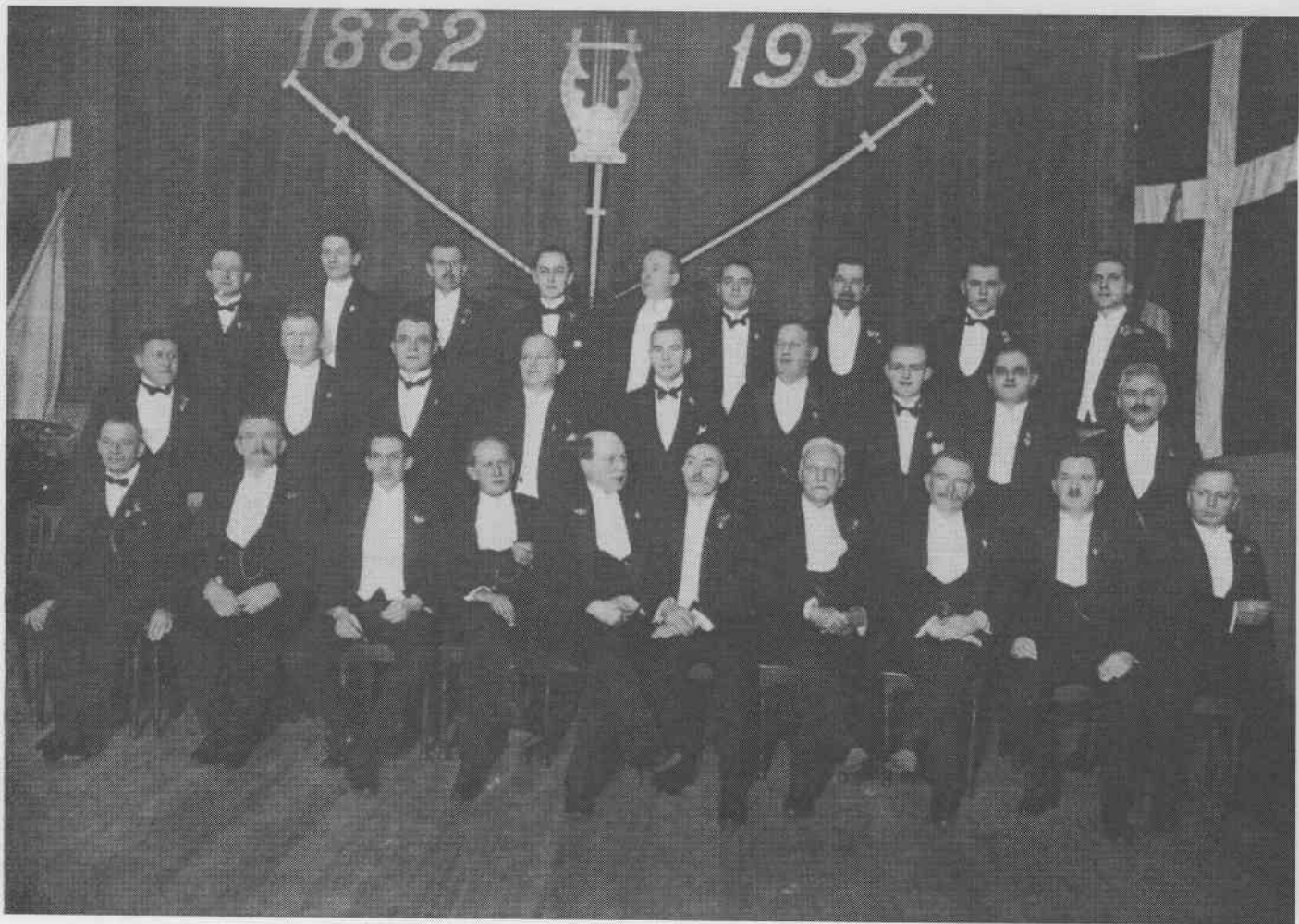
50 års jubilæet 1932