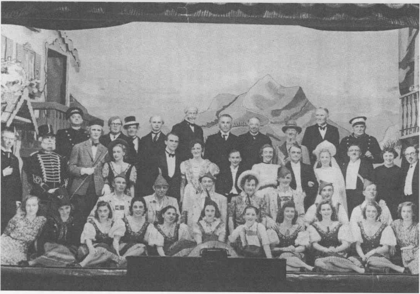
Sommer i Trondheim 1944